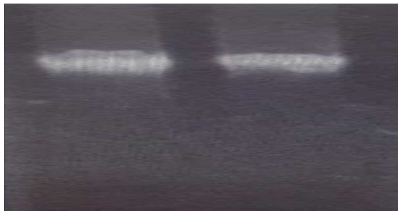
Hình 1. Phổ điện di DNA tổng số của hai mẫu Vero 76 MCB và WCB